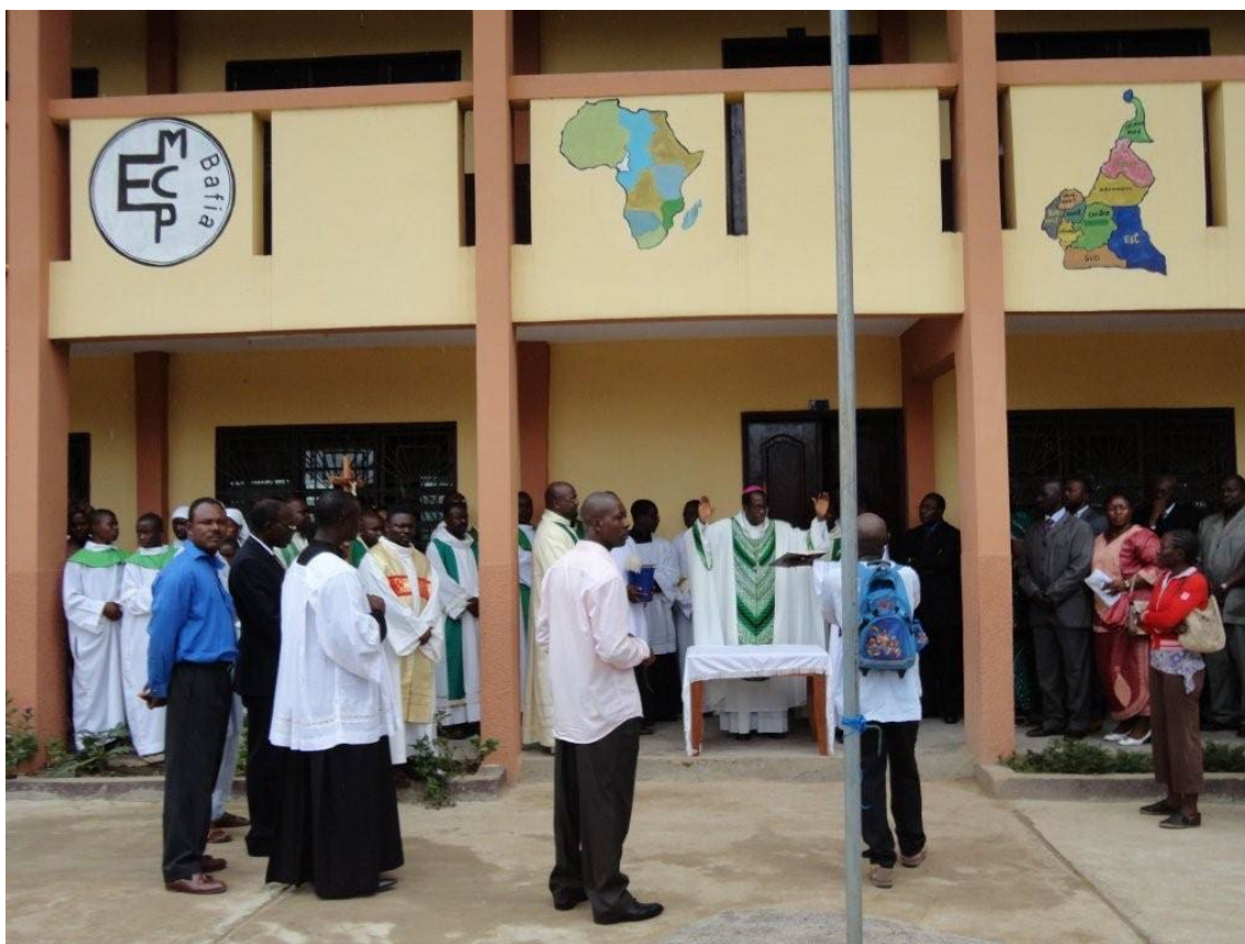
Bendición de la escuela de Bafia

Bafia, en la carretera de Yaundé hacia Bamendjou y Bamenda, y con un obispo amigo, se convierte en una fundación deseada. Así lo entiende la Congregación Provincial, y así publican la petición hecha al P. General en "Peralta" nº 116 (septiembre de 2005):