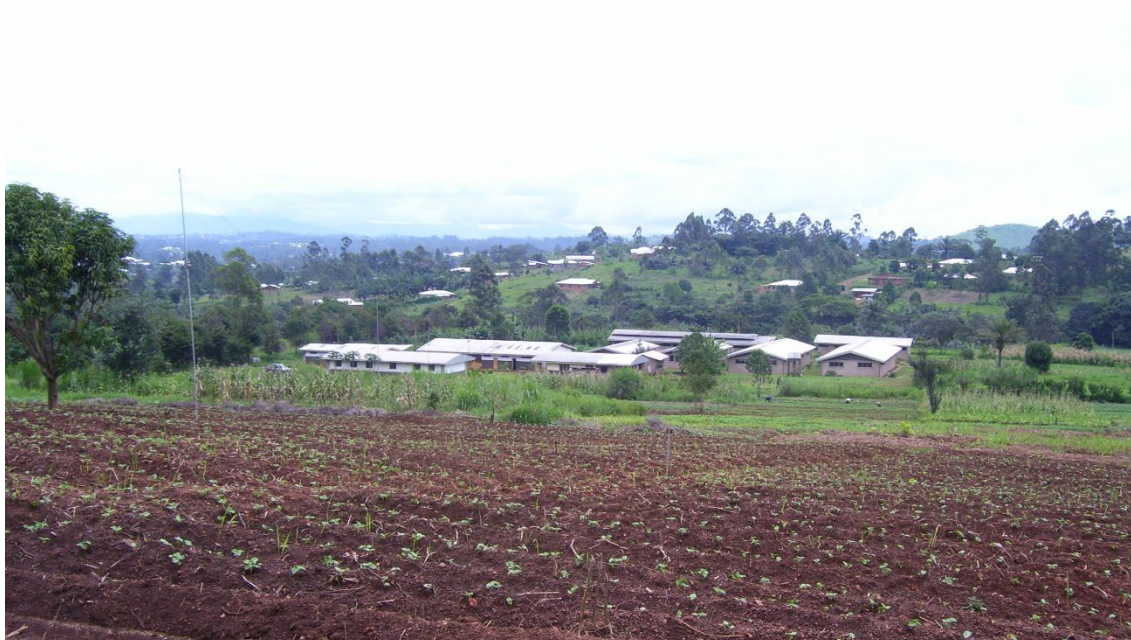
Complejo agropecuario-educativo de Menteh

He estado estudiando (febr. 1999) el documento-borrador enviado desde la Congregación General de la Orden "El ministerio escolapio: evangelizar educando con estilo calasancio". Como documento referencial me ha parecido muy bueno. En el apartado C, "Algunos elementos de nuestra acción educativa", al hablar de la Formación Profesional, líneas de acción, dice: "La potenciación de la escuela calasancia de lo que ya inicialmente era promotora: la preparación para la vida laboral-profesional, y en lo que ha ido mermando su dedicación. El poder incorporarnos a este abundante campo, tanto más cuanto que – en el momento actual – en esta etapa educativa se concentran los alumnos más parecidos a la definición calasancia de "los preferentemente pobres".