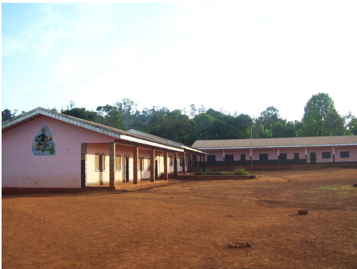
Escuelas de Toumi

El P. Stanis envía noticias a "Peralta" nº 116 (septiembre de 2005):