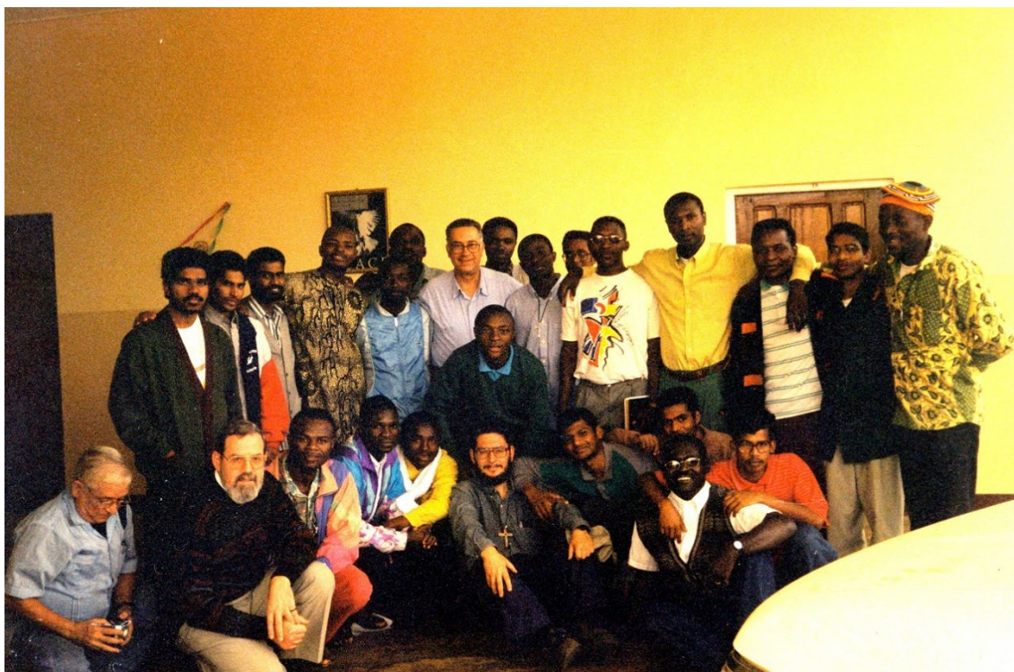
Visita del P. General y del P. Provincial a Kumbo, 2001

Reciba mi saludo y hágalo extensivo a la Curia General. Unido en la oración.