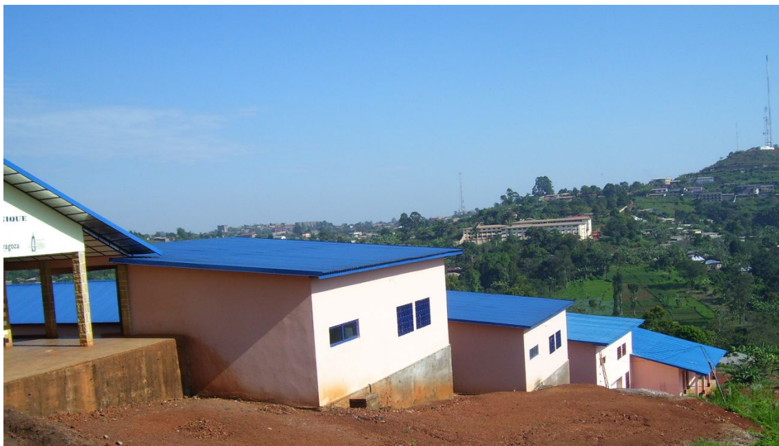
Colegio Técnico Calasanz de Bandjoun

Aparte de estos “proyectos grandes”, se dan otros más pequeños en nuestras comunidades. Hemos hecho importantes avances en los últimos años en lo que se refiere a discernimiento, gestión y evaluación de los proyectos. Son las comunidades locales quienes deciden cuáles son las necesidades de cada propuesta. Luego se pone a consideración de la Comisión de Proyectos, que fue creada hace algunos años con el objeto de hacerles el seguimiento. Esta Comisión, después de recibir la aprobación de la Congregación Viceprovincial, busca los fondos necesarios, sea de forma independiente o a través de la Fundación Itaka de Camerún.