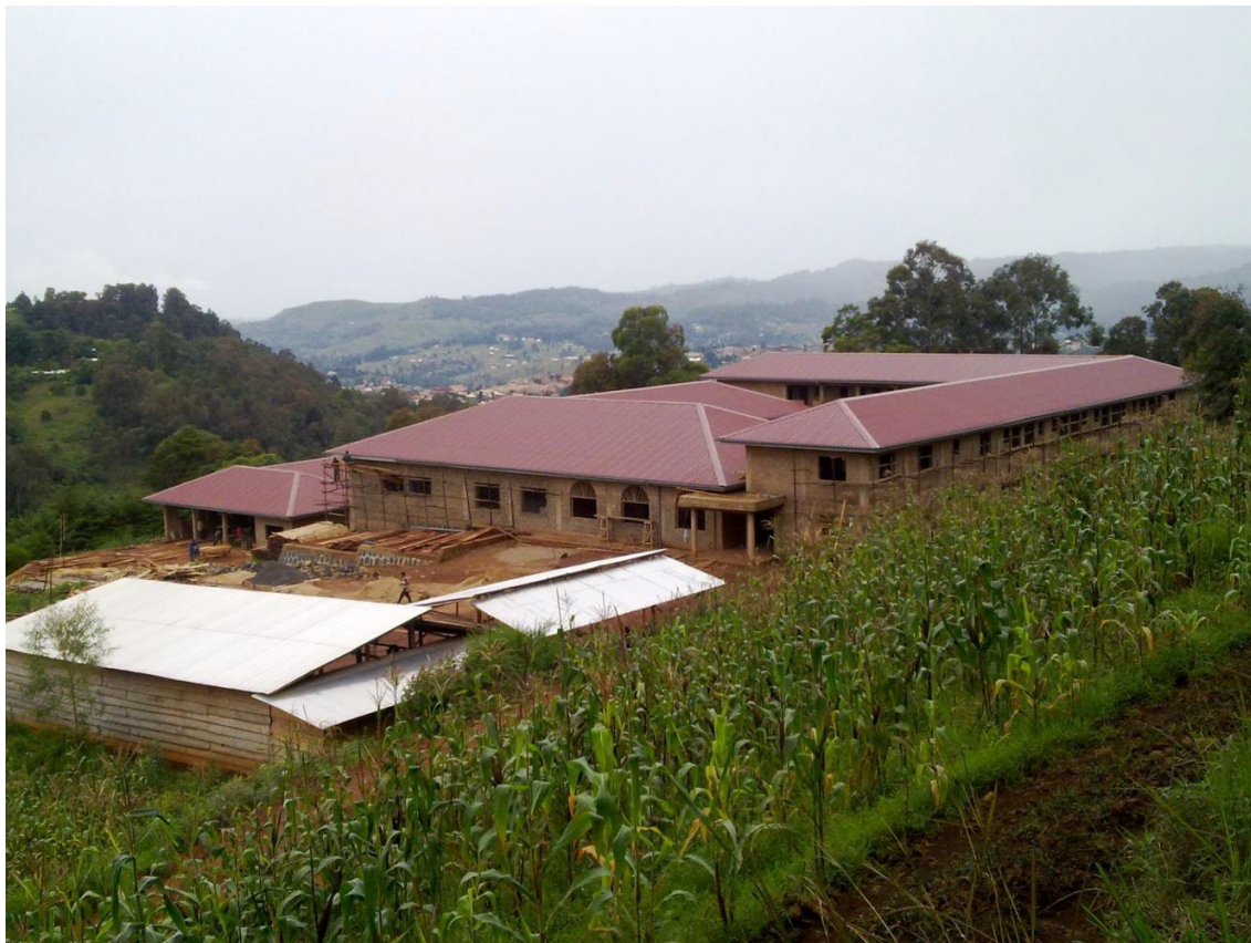
Nuevo noviciado de Kumbo

No voy a lamentarlo, desde luego. “Así nos convendrá”, como decía un padre que todos habéis conocido y que en gloria esté. La historia sigue avanzando, y nosotros, efímeras sombras, con ella. La realidad de la institución permanece, para gloria de Dios y utilidad del prójimo. Pero antes de que este vínculo entre Aragón y Camerún se rompa institucionalmente, quiero decir unas palabras, que creo que todos nos merecemos.