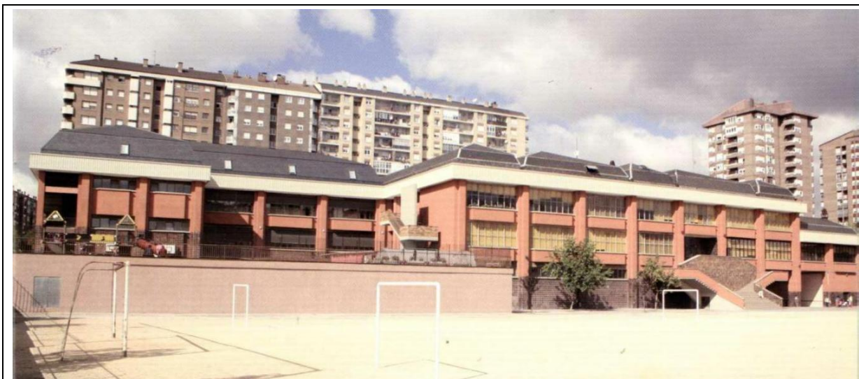
Vitoria - Gasteiz

En todas las plataformas en las que desarrollamos nuestra misión es fundamental el testimonio de nuestra vida personal y comunitaria. No sólo es importante lo que hacemos, sino cómo lo hacemos, tratando siempre de ser signos de los valores y opciones en las que creemos. Tanto la Provincia como las Fraternidades deberemos tener siempre muy en cuenta esta dimensión del testimonio de nuestra vida a la hora de nuestras planificaciones y revisiones.