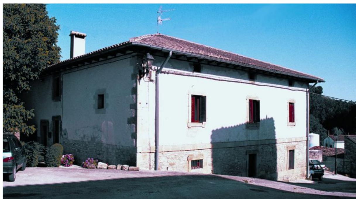
Comunidad de Riezu

Comunidad religiosa y cada pequeña comunidad de la Fraternidad, Equipo de presencia escolapia, Consejo Local o Comisión Permanente de cada Fraternidad, Equipo de animadores de la Fraternidad, Consejo de la Titularidad, Equipo de sede de la Fundación, equipo de ministros, diversos equipos locales.